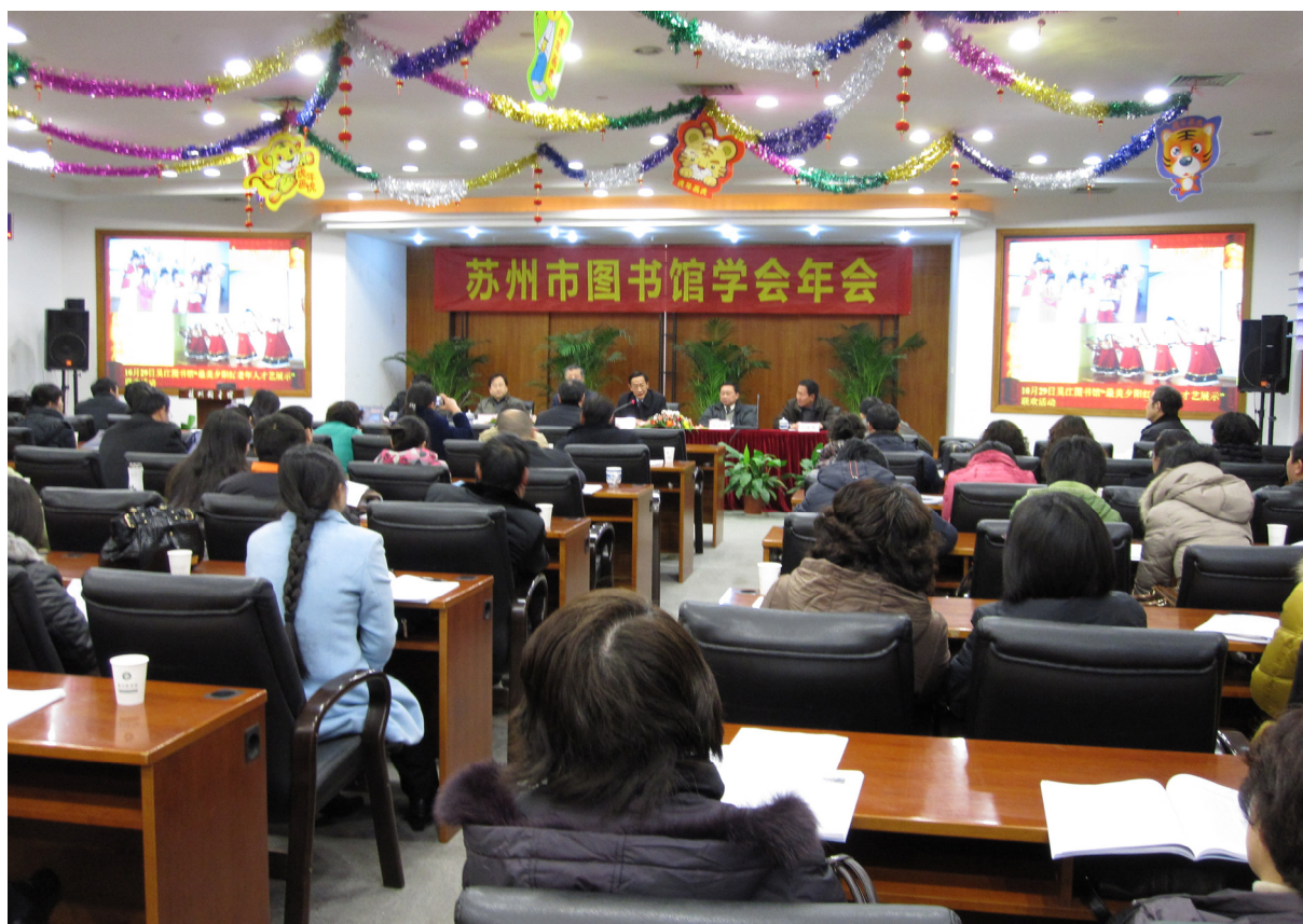
苏州市图书馆学会年会