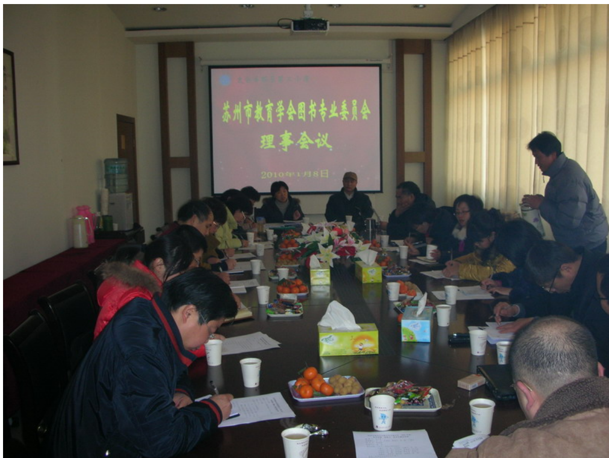
苏州市教育学会图书馆分会理事会议