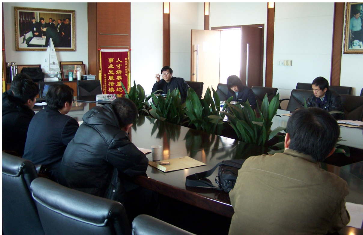
苏州市公共图书馆技术部主任第四次会议