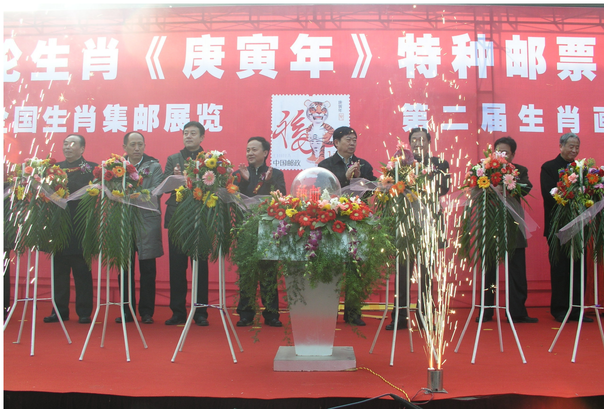
庚寅年生肖邮票展在苏州图书馆举办