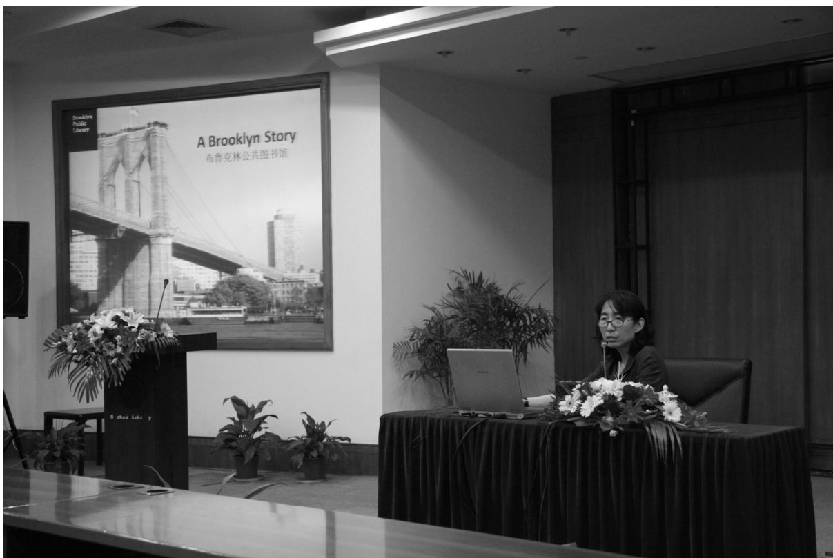
丁丽娜“美国公共图书馆服务及其相关政策”