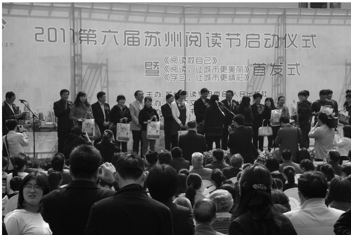
苏州阅读节向市民代表赠送“悦读宝贝”礼包