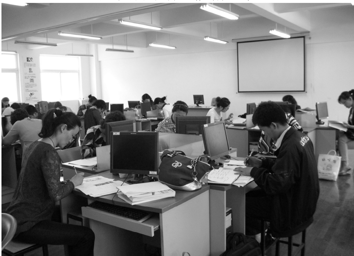
苏州市中小学图书馆人员专业培训