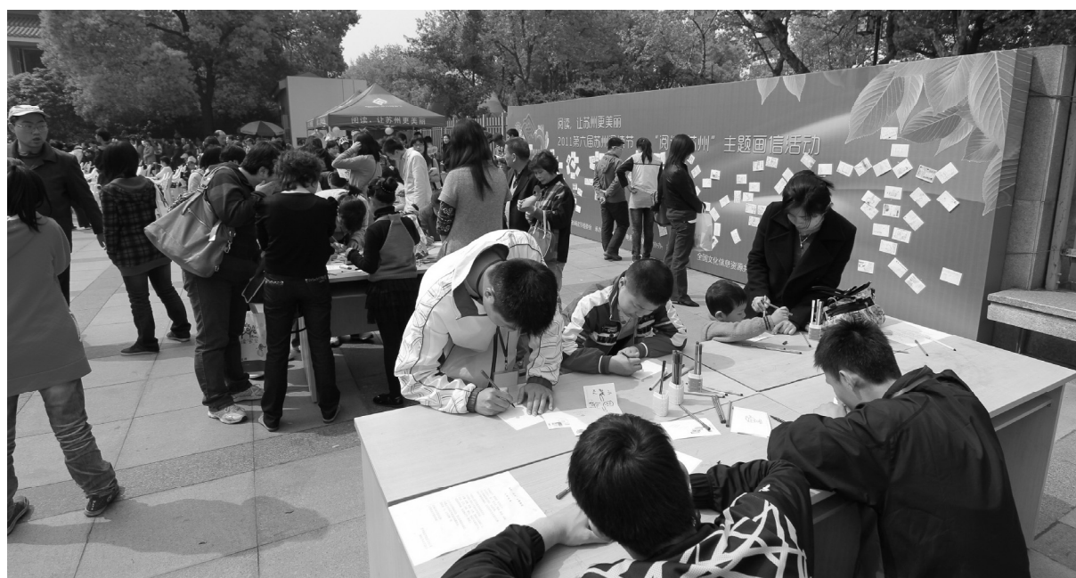
苏州阅读节“阅读苏州”主题画信活动