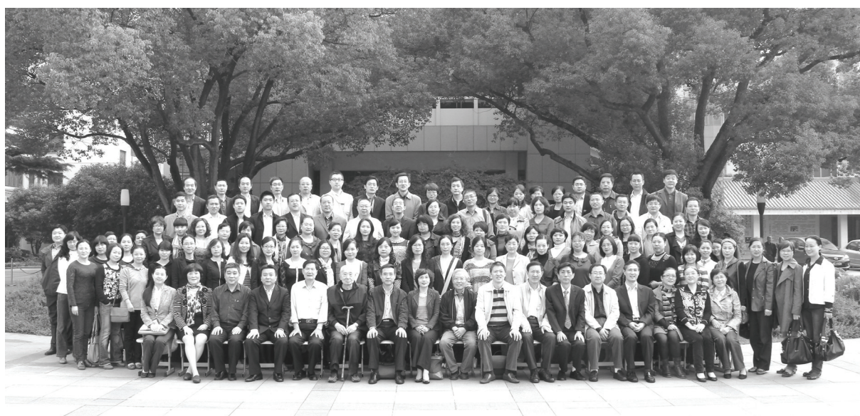
苏州市图书馆学第七届会员代表大会合影