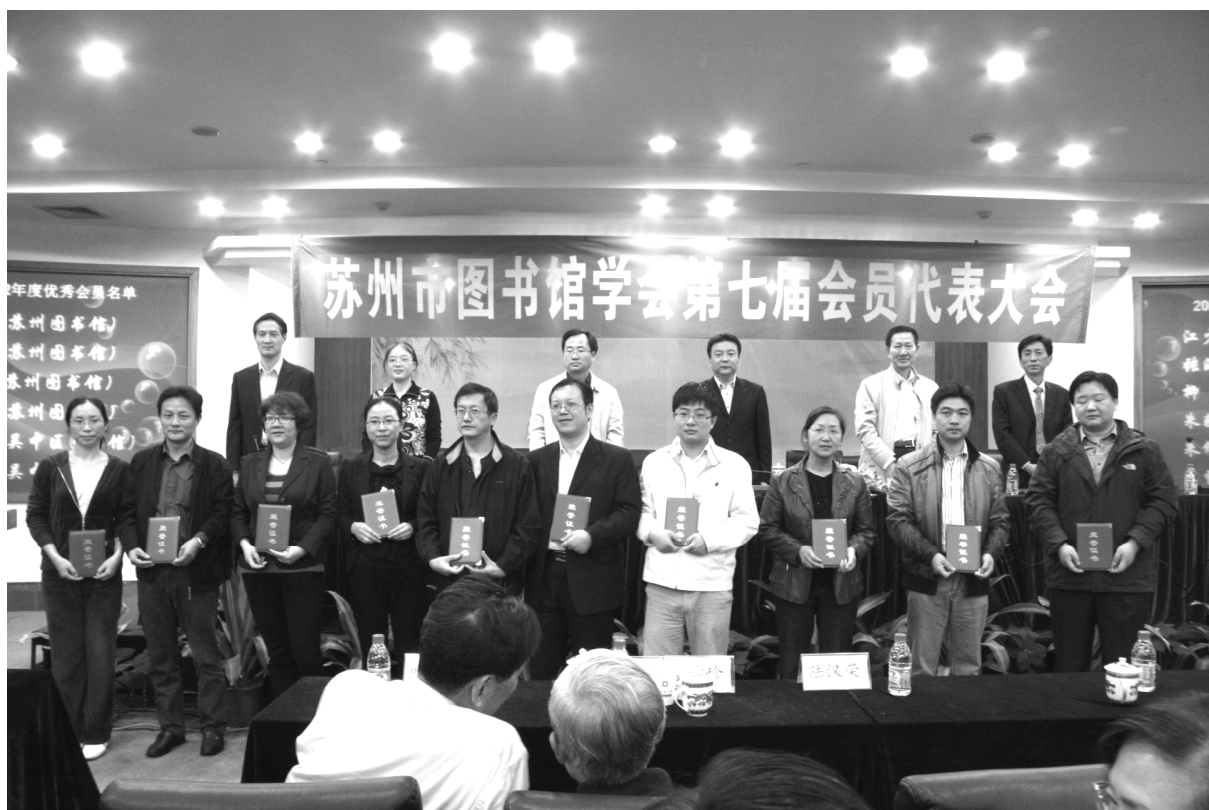
部分优秀会员上台领奖